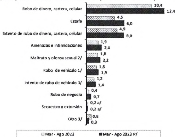
Gráfico N° 13 TASA DE VÍCTIMAS DEL ÁREA URBANA, POR TIPO DE HECHO DELICTIVO Semestre: Marzo – Agosto 2023 (Tasa por cada 100 habitantes de 15 y más años de edad)